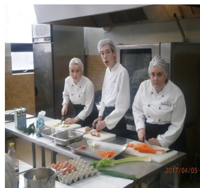
Mis en œuvre des techniques culinaires