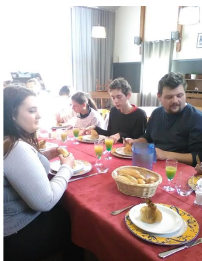
Dégustation des plats Franco-Norvégiens